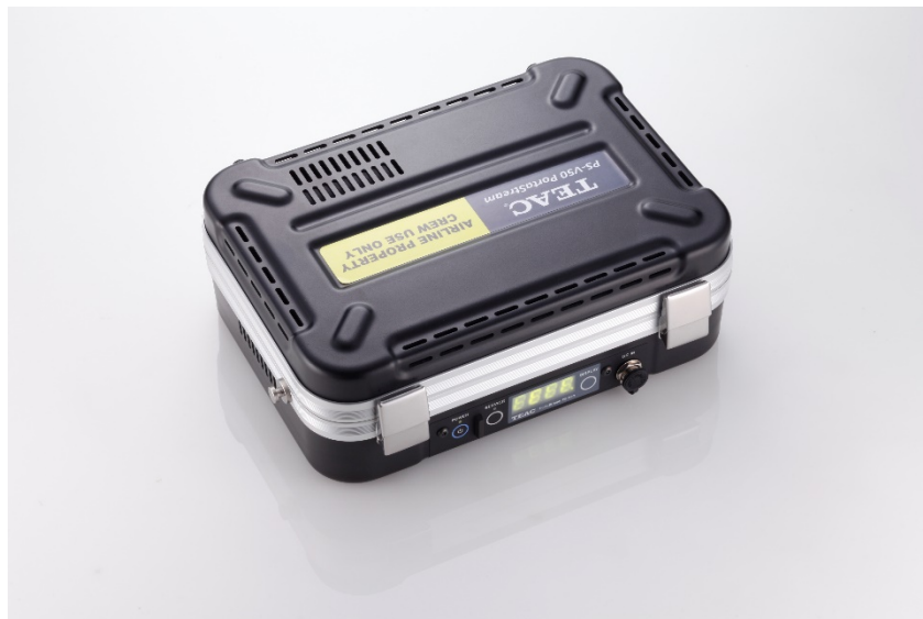
機内に搭載されるインフライトサーバー